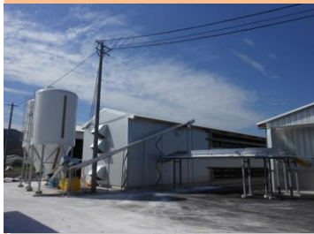
生産農場：卵卵中野ファーム