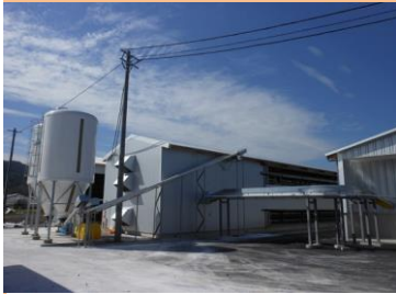
生産農場: 卵卵中野ファーム 所在地: 松山市中野町